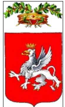
L'emblème de Pérouse

⇒ La galerie nationale de l'Ombrie renferme de nombreuses œuvres d'art dont les chefs d'œuvre des deux principaux peintres de l'Ombrie : le Pérugin et Pinturicchio